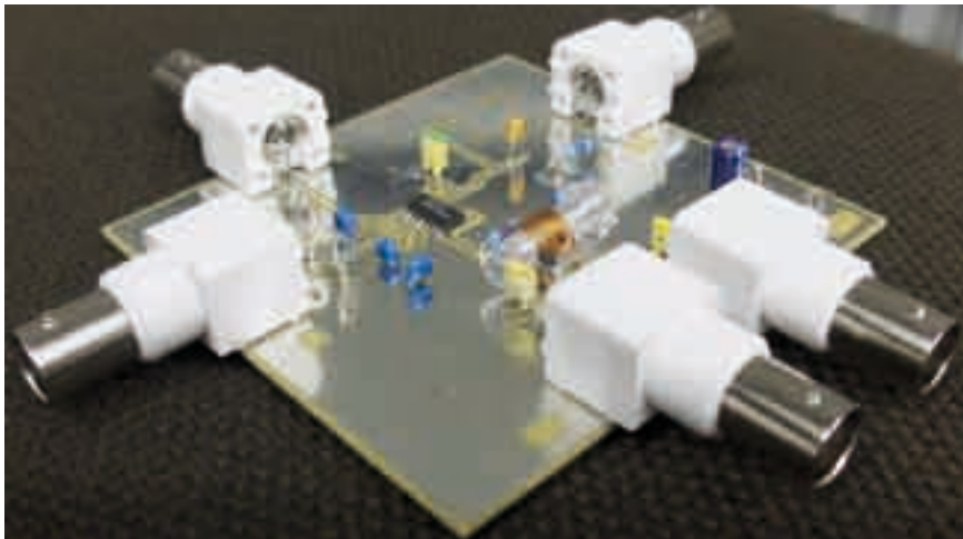
Bild 2: Platine des I/Q-Mischers. Im Zentrum der Baustein RF 2713, der in SMD-Technik ausgeführt ist. Die Luftspule ist Bestandteil des Anpassungsnetzwerks